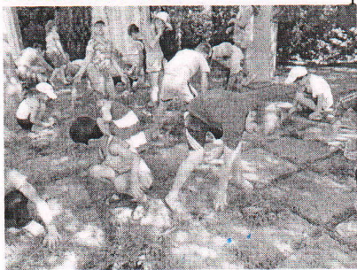
Забота о памятных местах станицы.